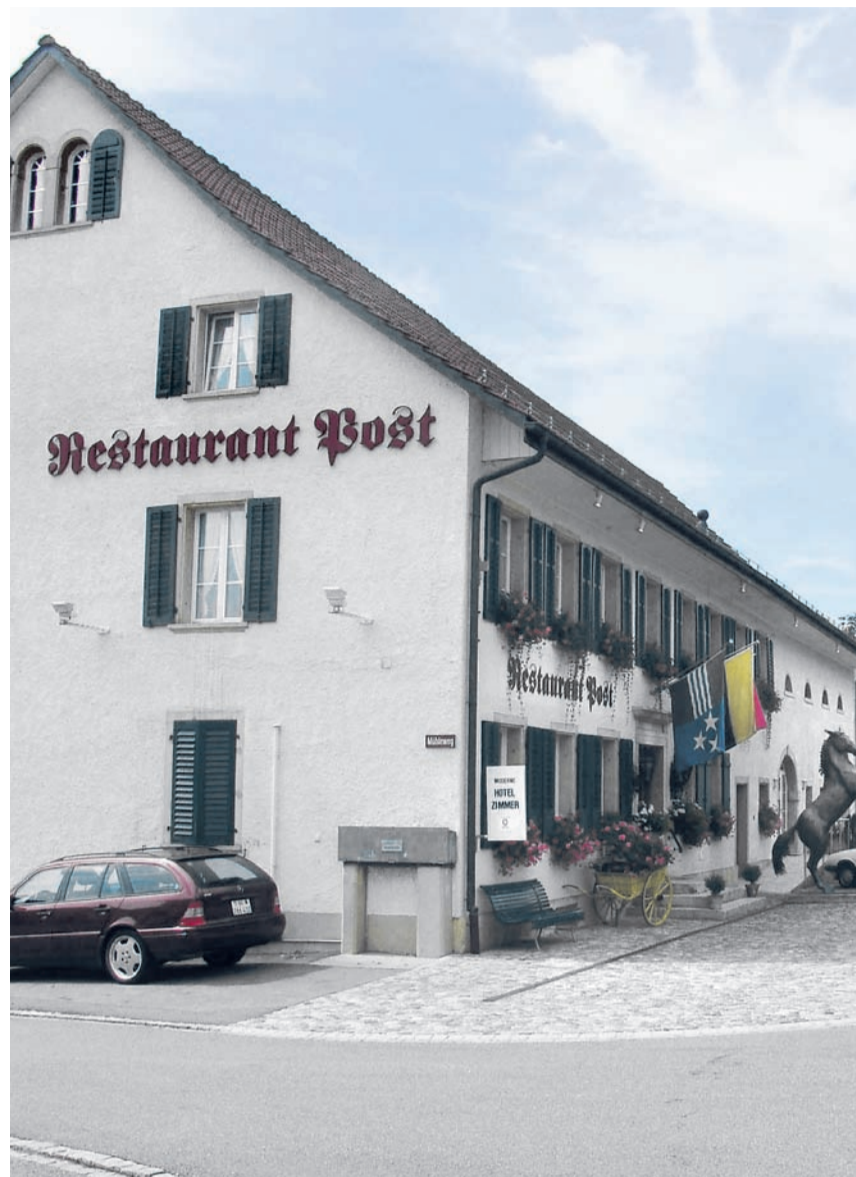
Direkt an der Hauptstrasse und doch sehr gemütlich: Die Post in Bözen.

Le restaurant Post, à Bözen (AG), est un hôtel. Certes un petit avec ses cinq chambres, mais il connaît le succès. Les prix des chambres de cet établissement C3 sont modérés et son taux d'occupation de près de 70 pour cent. Le succès tient aussi à la bonne cuisine de cette établissement de la Gilde de la famille Heuberger.